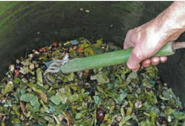
Le brassage permet de décompacter le compost, de l'aérer et d'assurer une transformation régulière.